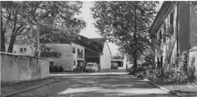
Im neuen Kindergarten „St. Martin“ zeigt Jörg Hilfinger bis 30. Oktober 2011 Impressionen Feldkirchs in Öl und Acryl im Rahmen der Feierlichkeiten zur 1250-Jahr