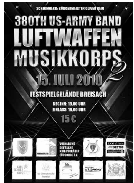
Ende des redaktionellen Teils

sucht: Erfolgreiche Projekte für Demokratie und Toleranz Mit dem Wettbewerb "AKTIV FÜR DEMOKRATIE UND TOLERANZ" sucht vorbildliche und nachahmbare zivilgesellschaftliche Aktivitäten aus dem gesamten Bundesgebiet, die sich aktiv für ein gleichberechtigtes Miteinander und gegen Extremismus, Antisemitismus und Gewalt einsetzen. Welche Aktivitäten gesucht werden, die Teilnahmebedingungen und vieles mehr erhalten Sie unter: Bündnis für Demokratie und Toleranz Friedrichstraße 50, 10117 Berlin, Telefon 030 2363408-0, Fax 030 23634018-88 E-Mail: buendnis@bfdt.de , www.buendnis-toleranz.de