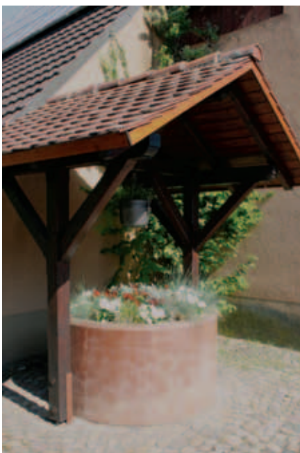
Brunnen in der Schmiedegasse Hartheim