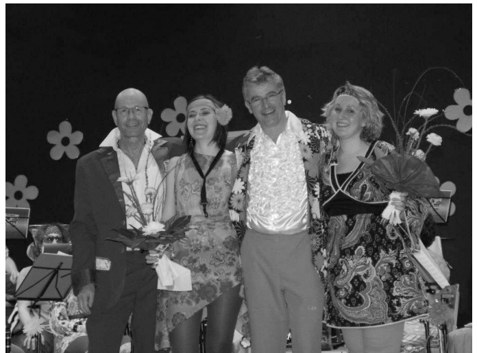
Der MV Feldkirch in schrillum Look